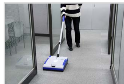
▲カーペットフロアの清掃