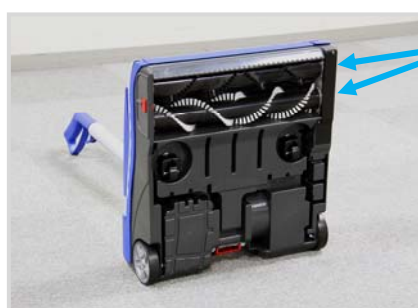
ソフトと ハードの ツインブラシ