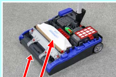
吸引口 ダストバッグ

●吸引口とダストバッグが近接しているためエネルギーロスが抑えられ、モーターパワーを最大限に活かして効率よく吸引します。