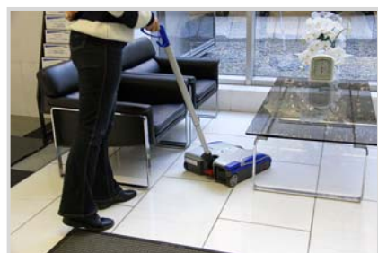
▲ハードフロアの清掃