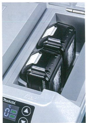
18Vバッテリー(1本でも使用可能)