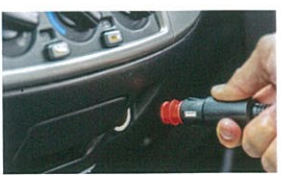
自動車シガーライターソケット